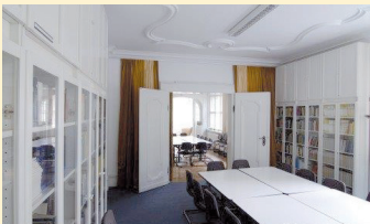
PAIB SEMINARRAUM IN DER GOERZALLEE 5

FREUD, S.: ZUR FRAGE DER LAIENANALYSE, 1926, GW XIV, S. 260